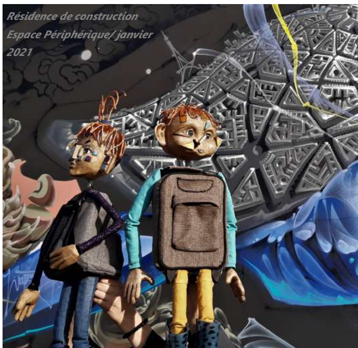
Résidence de construction Espace Périphérique/ janvier 2021

gaedig.bonabesse@gmail.com Gaedig Bonabesse