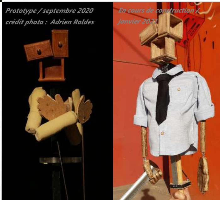
En cours de construction / janvier 2021