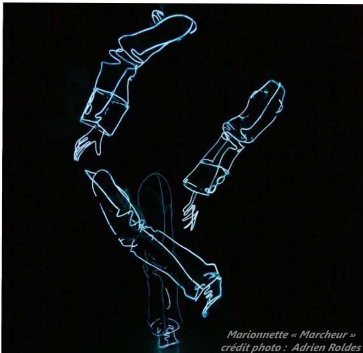
Marionnette « Marcheur »