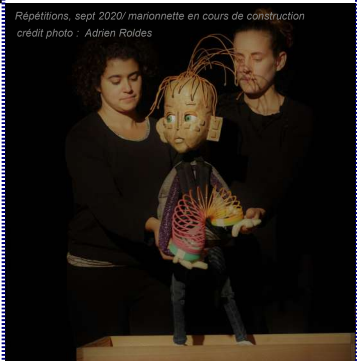
Répétitions, sept 2020/ marionnette en cours de construction

gaedig.bonabesse@gmail.com Gaedig Bonabesse