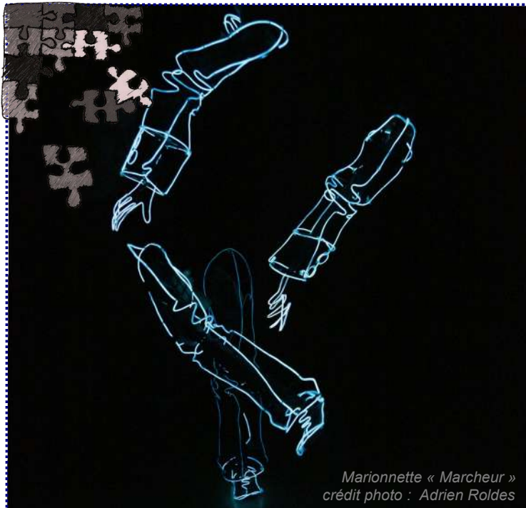
Marionnette « Marcheur »